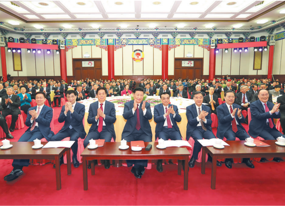
12月29日,全国政协在北京举行新年茶话会。党和国家领导人习近平、李克强、栗战书、汪洋、王沪宁、赵乐际、韩正、王岐山出席茶话会并观看演出。

新华社北京12月29日电 中国人民政治协商会议全国委员会12月29日上午在全国政协礼堂举行新年茶话会。党和国家领导人习近平、李克强、栗战书、汪洋、王沪宁、赵乐际、韩正、王岐山等同各民主党派中央、全国工商联负责人和无党派人士代表、中央和国家机关有关方面负责人以及首都各族各界人士代表欢聚一堂,喜迎2019年元旦。 中共中央总书记、国家主席、中央军委主席习近平在茶话会上发表重要讲话。他强调,2019年是新中国成立70周年,是决胜全面建成小康社会关键之年。我们要崇尚学习、加强学习、崇尚创新、勇于创新,崇尚团结、增进团结,既抢抓发展机遇,又妥善应对挑战,鼓舞全党全国各族人民勇往直前,再创辉煌。 习近平代表中共中央、国务院和中央军委,向各民主党派、工商联和无党派人士、各人民团体,向全国广大工人、农民、知识分子、干部和各界人士,向人民解放军指战员、武警官兵、公安干警和消防救援队伍指战员,向香港特别行政区同胞、澳门特别行政区同胞、台湾同胞和海外侨胞,向关心和支持中国改革开放和现代化建设的各国朋友,致以节日的问候和诚挚的祝福。 习近平强调,2018年,是贯彻落实中共十九大精神开局之年,也