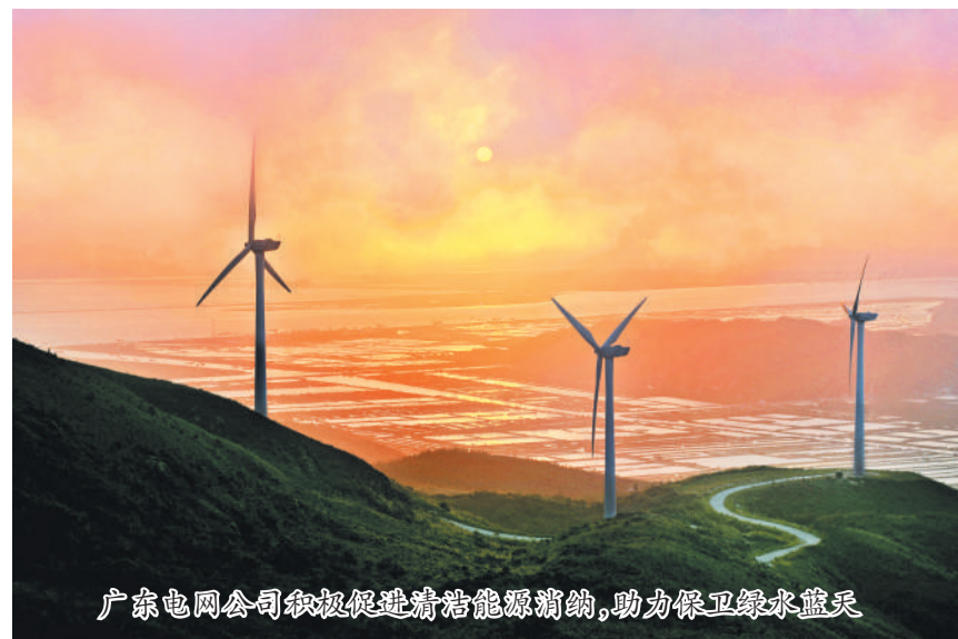
广东电网公司积极促进清洁能源消纳，助力保卫绿水蓝天

西电东送40年，送电量和送电能力大幅增长，源源不断的“清洁电”将西部的绿水蓝天“复制”到了广东。节能发电调度十年，广东电网深植绿色发展理念，持续推进西电东送受端通道建设，积极促进清洁能源消纳。如今，广东电网正积极推进电力现货市场建设，为清洁能源调度提供市场化解决方案，更好地促进西电东送的有效落地。