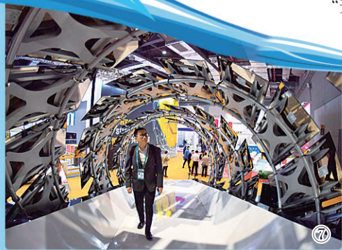
图⑦ 今年11月份,首届中国国际进口博览会在上海国家会展中心举行。