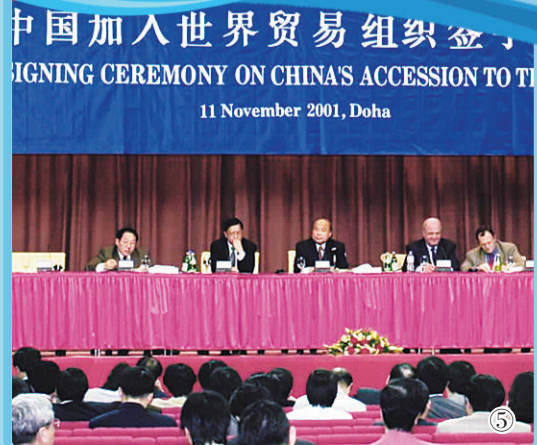
图⑤ 2001年11月份,中国加入世界贸易组织。图为签字仪式新闻发布会会场。(资料图片)

目前,上海自贸区正在酝酿步入高质量发展的4.0时代,除继续承担好国家使命,在深化改革和扩大开放上探索新路径、积累新经验外,借助增设自贸区新片区的契机,上海自贸区将进一步推动贸易自由化向纵深拓展,用“大胆试、大胆闯、自主改”为改革开放赋能,助力打造中国经济“升级版”。