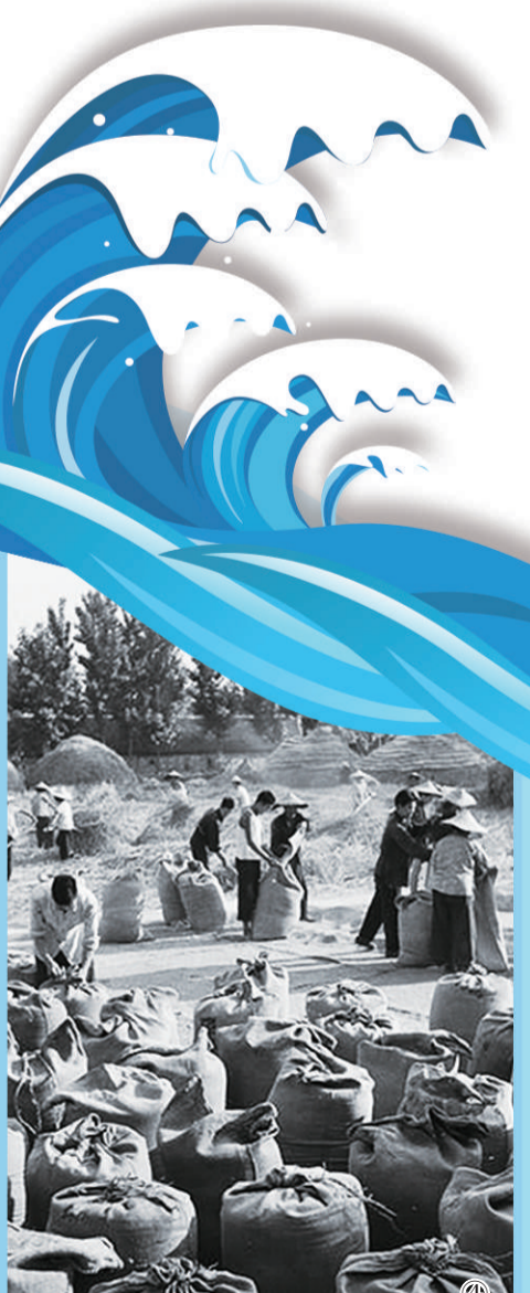
图④ 1979年秋,分田到户后的小岗村迎来大丰收。