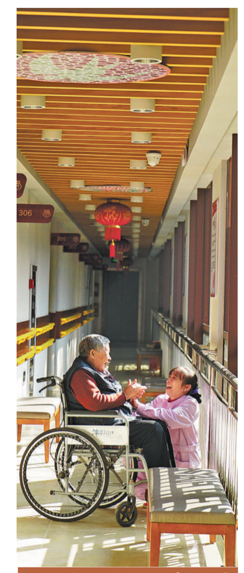
2017年11月1日,赣州市章贡区三康社区五保户(右)陈大爷在老人活动中心。