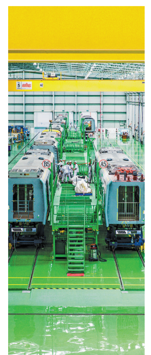
在马来西亚中部的峇株巴辖,工人在马来西亚中车轨道交通设备有限公司蒙恩车间工作。