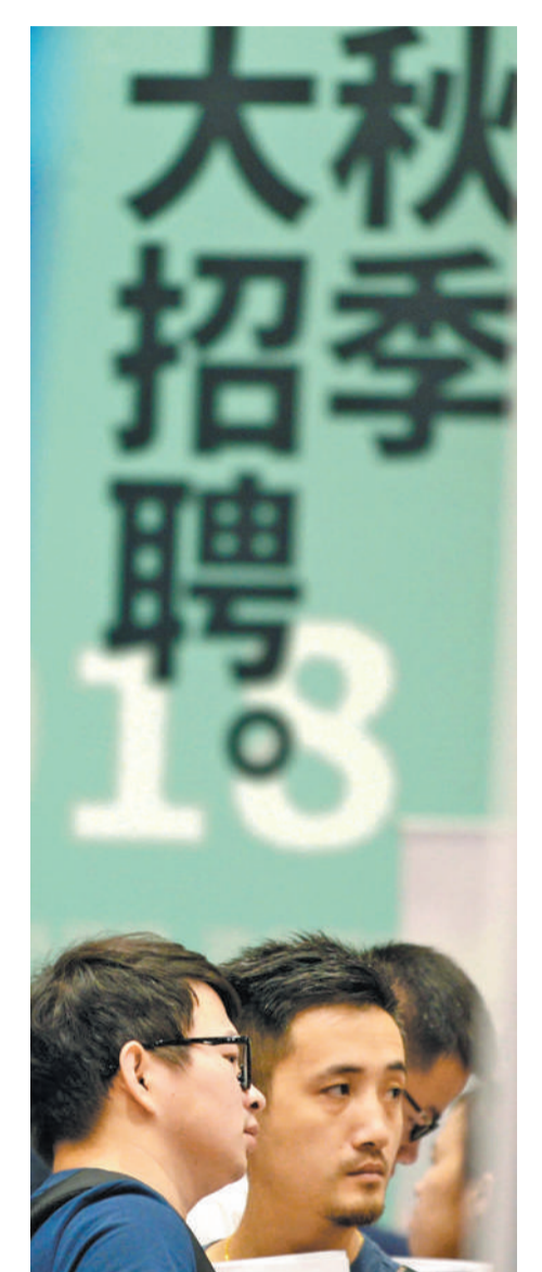
2018年9月15日,求职者参加2018昆明市人才交流大会现场招聘会。新华社记者 蔺以光摄