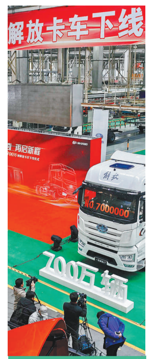
2018年11月30日,一汽解放第700万辆解放卡车下线仪式。