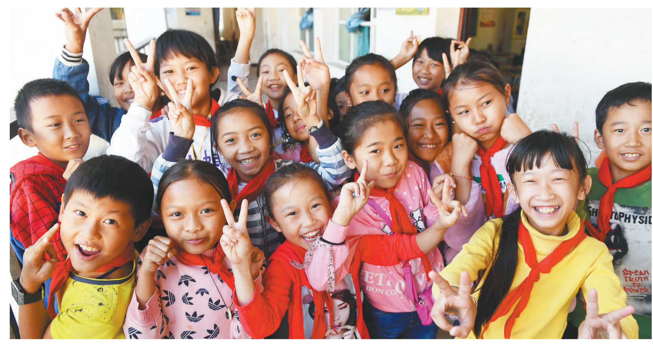
改革开放40年来,云南省西双版纳傣族自治州景洪市基诺山基诺族乡基诺族同胞生活面貌焕然一新,这是基诺山基诺族乡民族小学的学生。