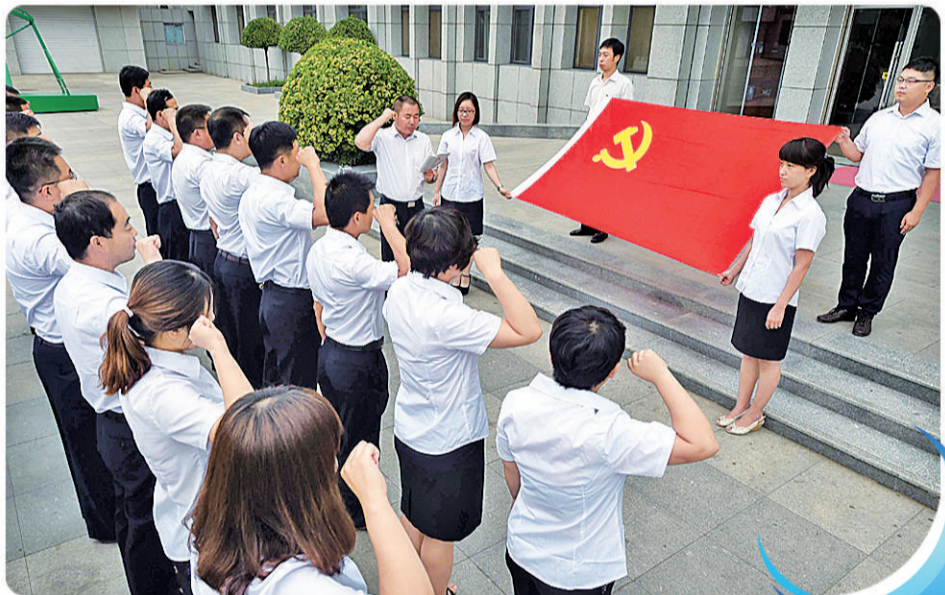
河北省文安县部分党员在“三严三实”主题党课活动中重温入党誓词（2015年6月29日摄）。新华社记者 李晓果摄