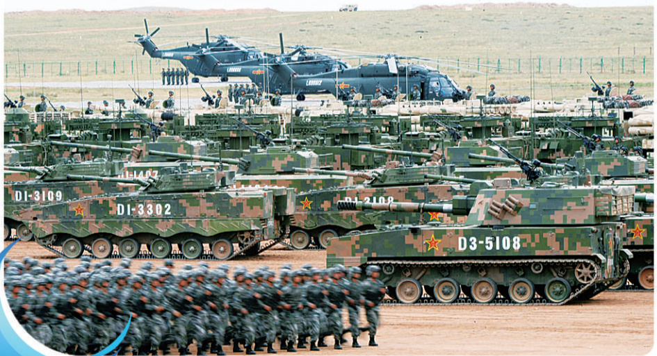
2017年7月30日，庆祝中国人民解放军建军90周年阅兵在位于内蒙古的朱日和训练基地举行。图为地面方阵迅速集结。