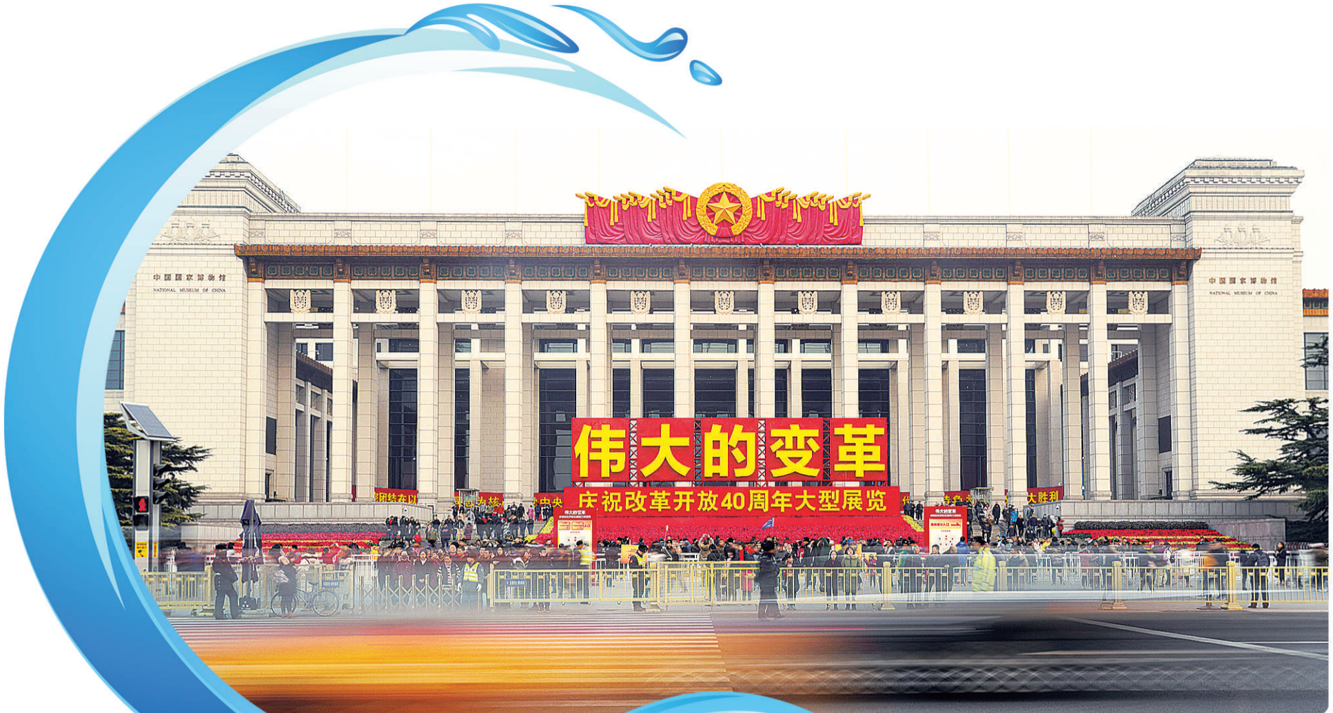
12月17日，北京中国国家博物馆，“伟大的变革——庆祝改革开放40周年大型展览”吸引了众多观众前来参观。

在中国共产党的坚强领导下，我们必将不断夺取新的更大的胜利，迎来中华民族伟大复兴。