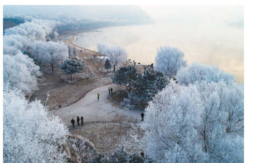
12月11日，吉林市松花江畔出现美丽的雾凇景观，沿江树木披上“银装”。

●日前，吉林省农业科学院优质粳稻国际联合研究中心成立，将助力全省大米品牌建设和稻米产业发展，为实施乡村振兴战略提供科技支撑。该中心旨在合作开展优质粳稻全产业链关键技术研发和转化，为吉林省稻米产业发展提供国际“智库”。