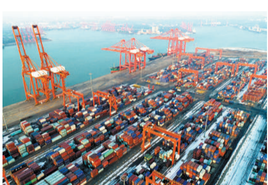
图为唐山港京唐港区集装箱码头。今年1月至11月，唐山港完成集装箱吞吐量269.2万标箱，同比增长21.56%。