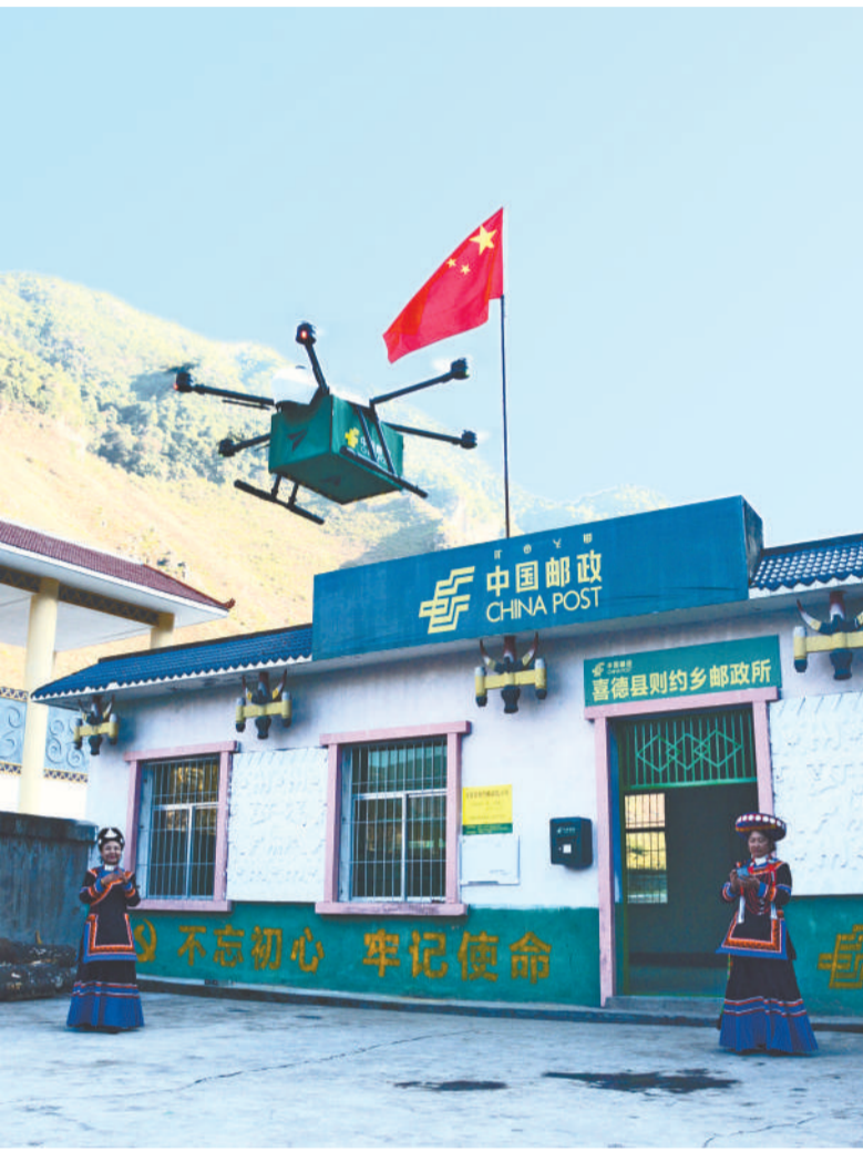
喜德县则约乡邮政所代办员在接收无人机运送来的邮件。

“ 改革开放40年来,四川省凉山彝族自治州经历了不同寻常的邮路变迁,从马班邮路到自行车、摩托车、货车、无人机运邮,从单一的信函业务到包裹、电商等业务的蓬勃发展,如今的邮路已经变成群众的增收致富路