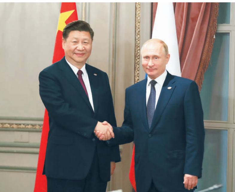
当地时间11月30日,国家主席习近平在布宜诺斯艾利斯会见俄罗斯总统普京。

新华社布宜诺斯艾利斯11月30日电 (记者刘华) 当地时间11月30日,国家主席习近平在布宜诺斯艾利斯会见俄罗斯总统普京。习近平指出,中俄关系发展顺应时代潮流和两国人民共同愿望,具有强大内生动力和广阔前景。今年以来,中俄双方共同努力,推动各领域合作取得一系列新的成果。明年是中俄建交70周年,这将是两国