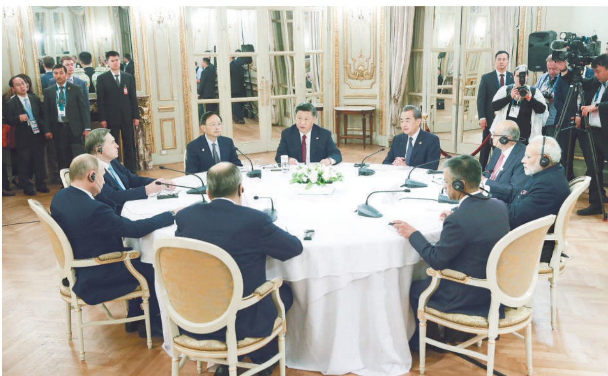
当地时间11月30日,国家主席习近平在布宜诺斯艾利斯出席中俄印领导人非正式会晤。习近平同俄罗斯总统普京、印度总理莫迪就新形势下中俄印合作深入交换意见。

新华社布宜诺斯艾利斯11月30日电 (记者霍小光 黄尹甲子) 当地时间11月30日,国家主席习近平在布宜诺斯艾利斯出席中俄印领导人非正式会晤。习近平同俄罗斯总统普京、印度总理莫迪就新形势下中俄印合作深入交换意见。三国领导人一致同意加强三方协调,凝聚三方共识,增进三方合作,共同促进世界的和平、稳定、发展。