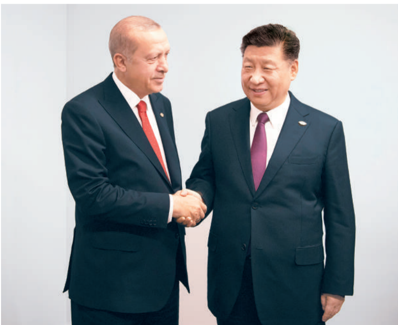
当地时间11月30日,国家主席习近平在布宜诺斯艾利斯会见土耳其总统埃尔多安。

新华社布宜诺斯艾利斯11月30日电 (记者黄尹甲子) 当地时间11月30日,国家主席习近平在布宜诺斯艾利斯会见土耳其总统埃尔多安。习近平指出,中土都是重要新兴市场国家。两国要加强团结合作,共享发展机遇,共迎风险挑战。近年来,我同总统先生保持密切沟通,共同引领中土战略合作迈上更高水