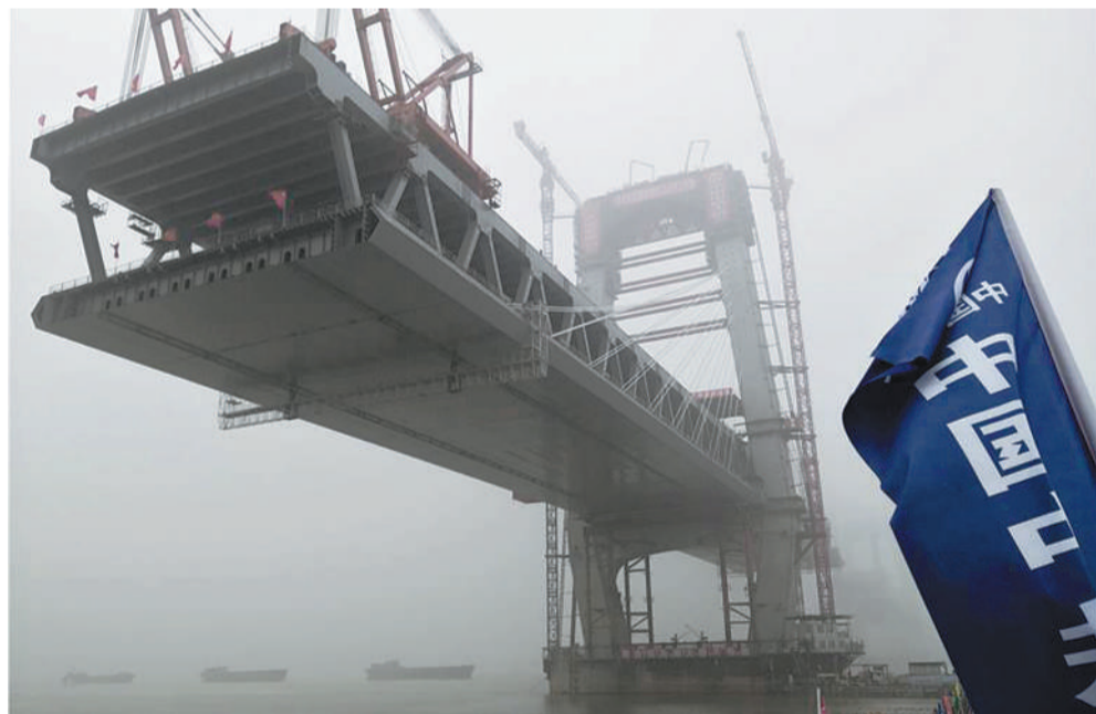
这是成功封顶后的商合杭铁路芜湖长江公铁大桥北主塔(11月30日摄)。

据介绍,大赛结束后,组委会还将开展一系列后续支持服务,深化赛事成果转化,推动项目孵化对接,继续推进创新引领创业、创业带动就业,持续助力林业和草原创新创业升级,致力打造独具林业和草原行业特色的“双创”品牌行动。首届全国林业创新创业大赛是国家林业和草原局深入实施国家创新驱动发展战略,积极推进大众创业万众创新,引导林科毕业生扎根基层、就业创业的一项具体举措。