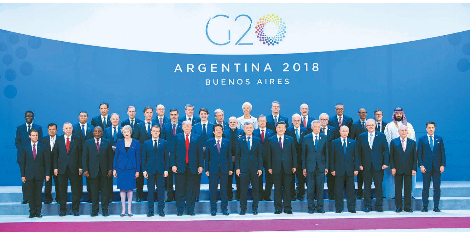
当地时间11月30日，二十国集团领导人第十三次峰会在阿根廷布宜诺斯艾利斯举行。国家主席习近平出席第一阶段会议并发表题为《登高望远，牢牢把握世界经济正确方向》的重要讲话。这是习近平同其他与会领导人合影。

当地时间20时05分许，习近平乘坐的专机抵达布宜诺斯艾利斯埃塞萨国际机场。习近平和夫人彭丽媛受到阿根廷外交部长福列、胡胡伊省省长莫拉莱斯等热情迎接。仪仗队长趋前致敬，军乐团奏响雄壮有力的进行曲，习近平和彭丽媛沿红地毯前行，礼兵分列红地毯两侧，行注目礼。（下转第三版）