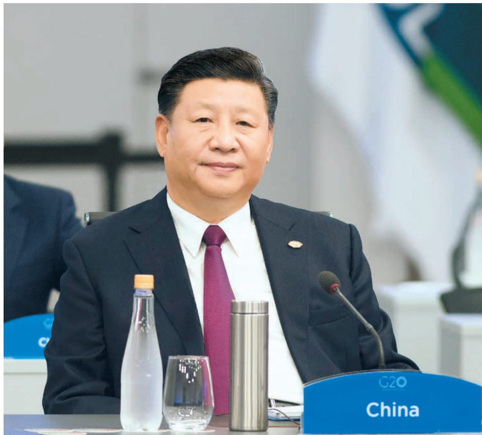
当地时间11月30日，二十国集团领导人第十三次峰会在阿根廷布宜诺斯艾利斯举行。国家主席习近平出席第一阶段会议并发表题为《登高望远，牢牢把握世界经济正确方向》的重要讲话。

强调要坚持开放合作、伙伴精神、创新引领、普惠共赢，以负责任态度把握世界经济大方向