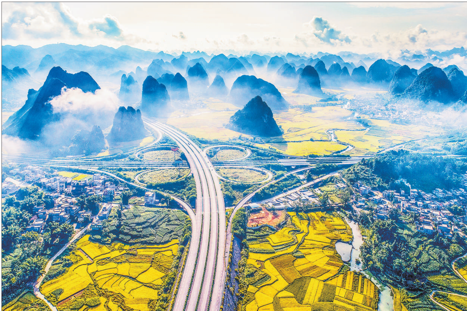
▼广西合浦县到那坡县的和那高速公路。改革开放40年来，我国高速公路从无到有，达到13.6万公里。