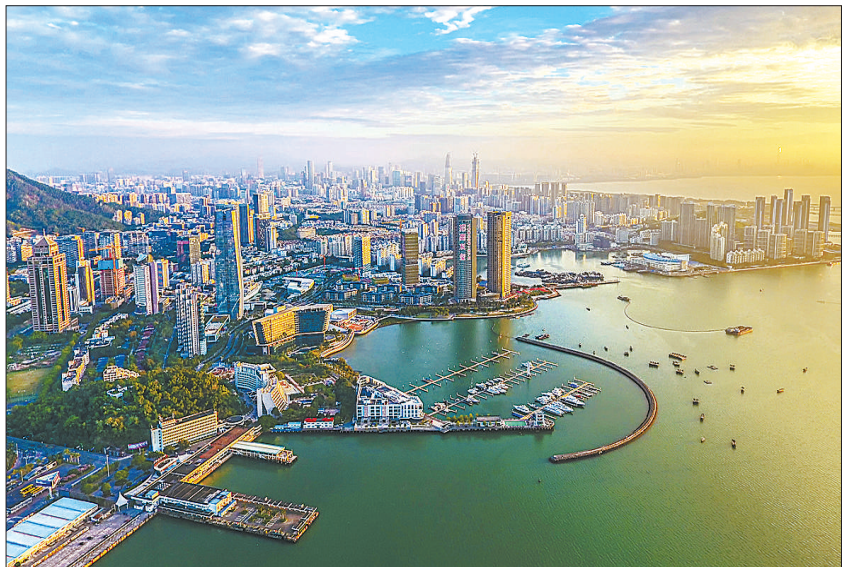
▲深圳特区蛇口港口。改革开放40年来，深圳发生了翻天覆地的变化。这个中国改革开放的“窗口”和“试验田”，正成为一座生机勃勃的创新之城、筑梦之城、未来之城。

历史总有印记，影像记录时代。为庆祝改革开放40周年，中国新闻摄影学会与光明网于2018年1月，在上海陆家嘴启动了“奋进新时代：全国主流媒体聚焦改革开放40周年——‘航拍中国’大型系列摄影活动”。我们通过多种形式，进行了历时10个月的航拍作品征集活动，最终收集到了15000余幅优秀摄影作品。这些作品中，既有改革开放前沿城市、“一带一路”重要节点城市的发展巨变，也有事关民生福祉的南水北调、西电东送等重大工程，还有“观天巨眼”“航母出海”等前沿科技与国防事业的辉煌成就。