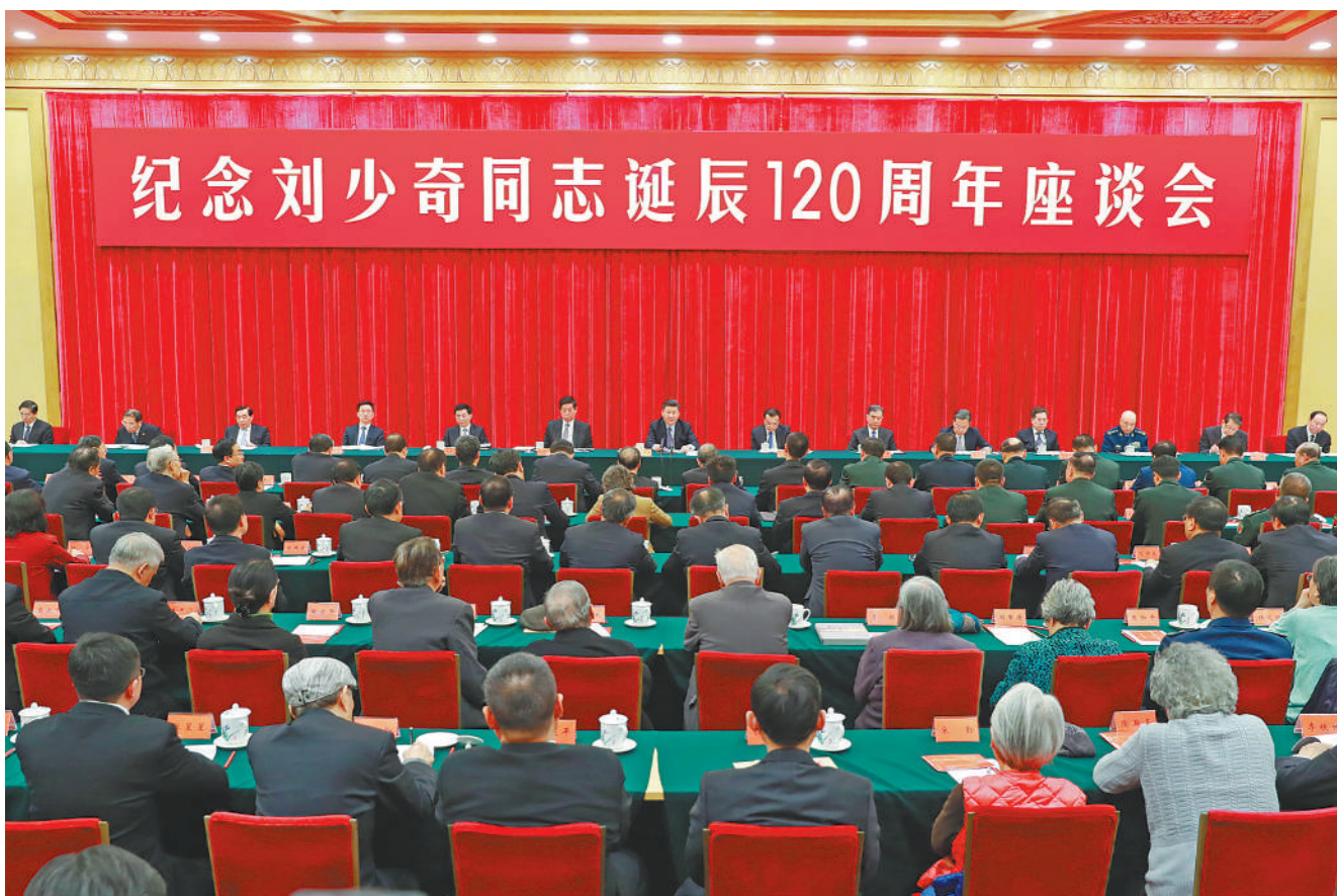
11月23日,中共中央在北京人民大会堂举行纪念刘少奇同志诞辰120周年座谈会。中共中央总书记、国家主席、中央军委主席习近平发表重要讲话,中共中央政治局常委李克强、栗战书、汪洋、王沪宁、赵乐际、韩正出席座谈会。

习近平指出,刘少奇同志是不忘初心、对党忠诚的光辉榜样。共产党人坚持的初心,就是对共产主义理想的坚定信仰,就是对党和人民事业的永远忠诚。心中有信仰,行动有力量。今天,我们学习刘少奇同志,就要牢记理想信念是共产党人安身立命的根本,是共产党人的政治灵魂,在立根固魂上下功夫,把共产主义远大理想同中国特色社会主义共同理想统一起来、同我们正在做的事情统一起来,增强“四个意识”,坚定“四