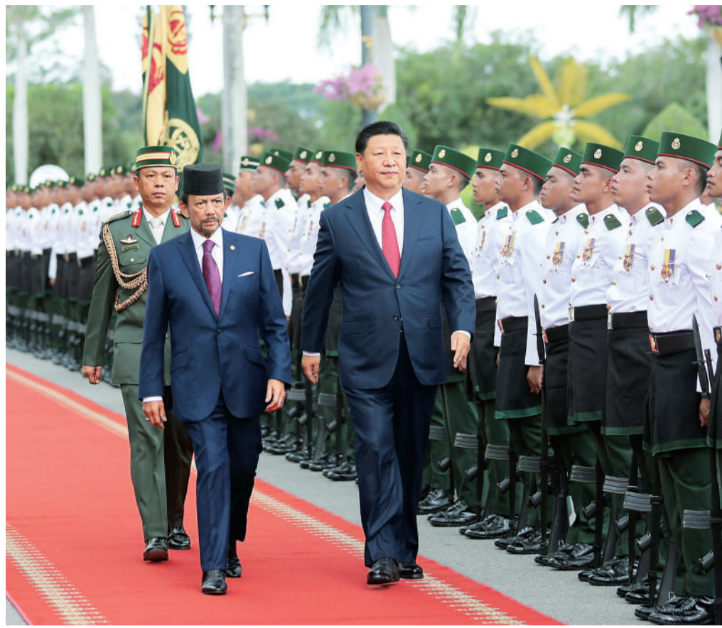
11月19日，国家主席习近平在斯里巴加湾同文莱苏丹哈桑纳尔举行会谈。会谈开始前，习近平出席哈桑纳尔在王宫前广场举行的盛大欢迎仪式。这是在哈桑纳尔陪同下，习近平检阅仪仗队。

新华社北京11月19日电 记者崔嵬、刘成报道：国家主席习近平19日在斯里巴加湾同文莱苏丹哈桑纳尔举行会谈。两国元首高度评价中文关系积极发展势头，一致决定建立中文战略合作伙伴关系，做政治互信、经济互利、人文互通、多边互助的好伙伴。 习近平高度评价哈桑纳尔长期关心和重视中文关系。习近平指出，这是我第一次到文莱，文莱人民的热情友好、特别是沿途欢迎的青少年脸上洋溢的真挚友好笑容，令人感动。这是中文两国人民深厚友谊的真实写照。文莱政通人和，人民安居乐业，不愧“和平之邦”的美誉。中国和文莱历史文化联系悠久深厚。两国是隔海相望的近邻，也是相互信赖的朋友和伙伴。双方决定建立战略合作伙伴关系，就是要做政治互信、经济互利、人文互通、多边互助的好伙伴，让合作成果更好惠及两国人民。 习近平强调，双方要密切高层交往，为两国关系发展掌好舵。中方赞赏文莱坚定奉行一个中国政策，将继续支持文莱走符合自身国情的发展道路。中方视文莱为建设21世纪海上丝绸之路重要合作伙伴，愿将“一带一路”倡议同文莱经济