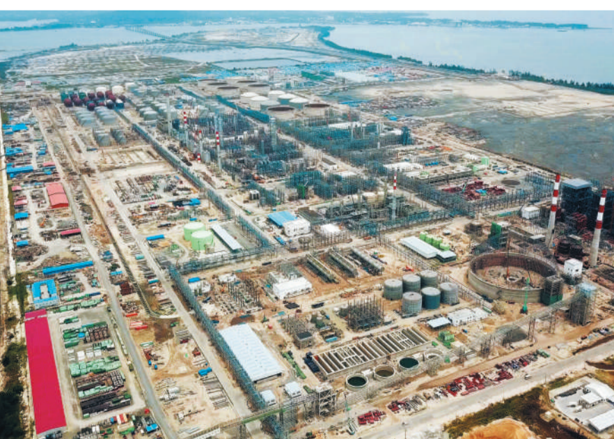
图为恒逸(文莱)大摩拉岛石油化工项目。

恒逸(文莱)大摩拉岛石油化工项目是中国企业在文单笔最大投资项目，自开工至今已源源不断地将中国在综合炼油领域的技术、人才和设备带到文莱，预计2019年投产后将打通文莱油气领域上下游产业，助力文莱支柱产业多元发展。依托“文莱—广西经济走廊”这一合作平台，