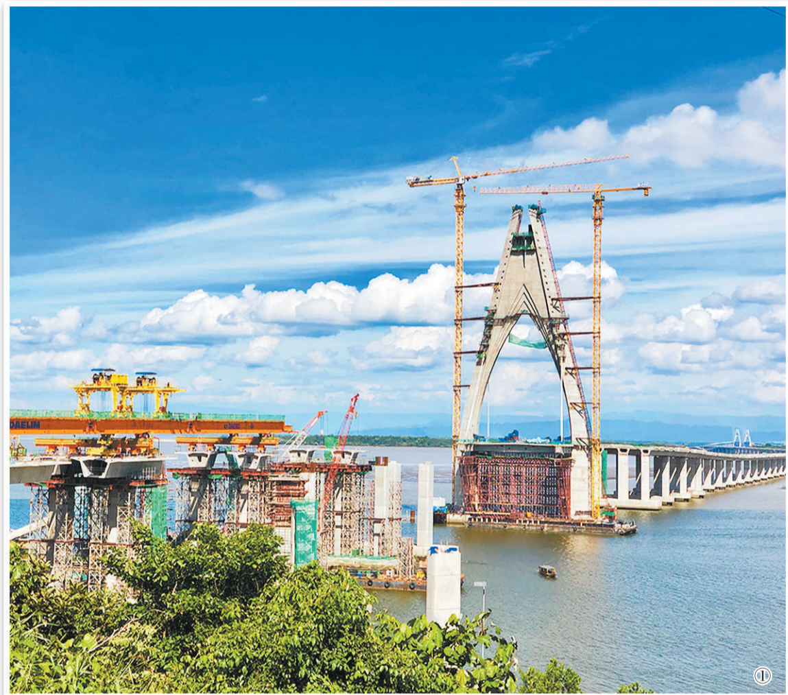
图① “一带一路”重点工程——文莱淡布隆跨海大桥项目施工现场。

国之交在于民相亲。中国与岛国间形式多样的人文交流，取得了丰硕的成果。岛国的碧海金沙、椰林树影、独特的民俗民风正吸引着越来越多的中国游客慕名而来。目前，中国赴岛国游客年均超过10万人次。同时，大量岛国青年学生、政府官员、技术人员到中国学习深造、考察研修。双方文艺团组交流互访频繁，中国海军“和平方舟”医院船访问巴新、斐济、汤加、瓦努阿图，为2万多名岛国民众提供了人道主义医疗服务，被岛国人民誉为“和平使者”。民心相通，使双方友好关系薪火相传，双方人民友谊更加深厚。