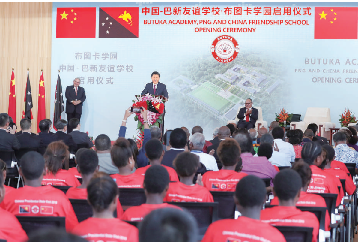
11月16日，国家主席习近平在莫尔兹比港和巴布亚新几内亚总理奥尼尔共同出席中国援建的布图卡学园启用仪式。

本报莫尔兹比港 11月16日电 记者翁东辉 王宝锐报道：国家主席习近平16日在莫尔兹比港和巴布亚新几内亚总理奥尼尔共同出席中国援建的布图卡学园启用仪式。