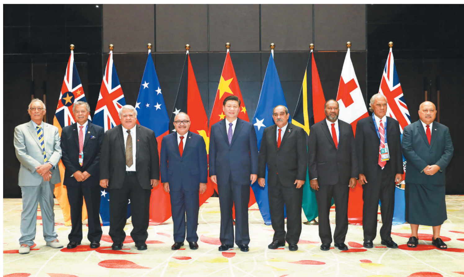
右图 11月16日,国家主席习近平在莫尔兹比港同巴布亚新几内亚总理奥尼尔、密克罗尼西亚联邦总统克里斯琴、萨摩亚总理图伊拉埃帕、瓦努阿图总理萨尔瓦伊、库克群岛总理普纳、汤加首相波希瓦、纽埃总理塔拉吉等建交太平洋岛国领导人以及斐济政府代表、国防部长昆布安博拉举行集体会晤。习近平主持会晤并发表主旨讲话。新华社记者 鹿兴雷摄

以诚相知、以礼相待、以心相交。中国始终坚持义利相兼、以义为先,支持岛国发展经济、改善民生、提高自主可持续发展能力。中方援助坚持授人以渔。中国主动向岛国开放市场,扩大投资,增加自岛国进口,欢迎岛国搭乘中国发展快车。随着中国同太平洋岛国交流合作蓬勃开展,双方人民友谊更加深厚。 习近平强调,亚太是全球经济发展速度最快、潜力最大的地区。面对时代命题,我们坚信,和平、发展、合作、共赢是唯一正确选择。当前,太平洋岛国自主发展意识不断提升,国际影响持续扩大。中国同太平洋岛国经济互补性强,合作潜力巨大。新形势下,我们的共同利益不是减少了,而是增多了;合作基础不是缩小了,而是扩大了。 习近平就深化中国和太平洋岛国关系提出以下建议。 第一,坚持平等相处,深化政治互信。中方愿同岛国保持高层和各级别交往势头,继续在涉及彼此核心利益和重大关切问题上相互支持。中方愿和岛国于2019年下半年共同举办第三届中国—太平洋岛国经济发展合作论坛。 (下转第二版)