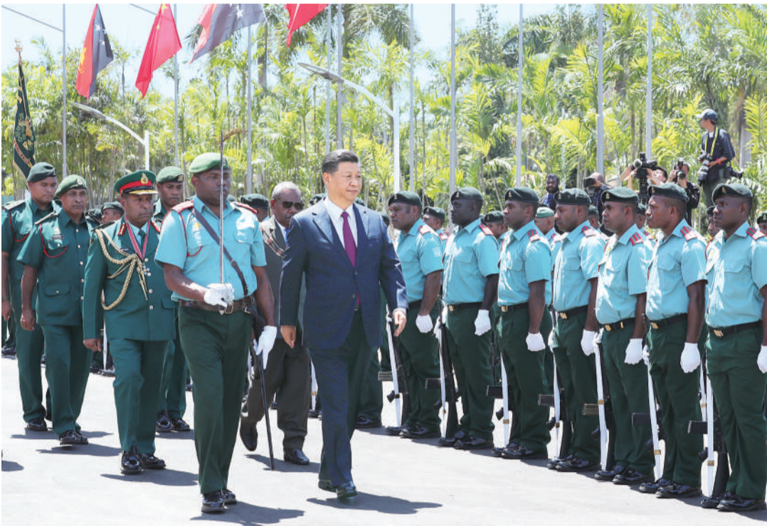
11月16日,国家主席习近平在莫尔兹比港会见巴布亚新几内亚总督达达埃。会见开始前,达达埃在议会大厦前广场为习近平举行隆重欢迎仪式。