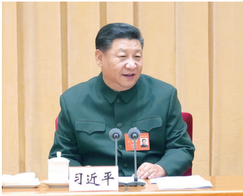
中央军委政策制度改革工作会议11月13日至14日在北京召开。中共中央总书记、国家主席、中央军委主席、中央军委深化国防和军队改革领导小组组长习近平出席会议并发表重要讲话。