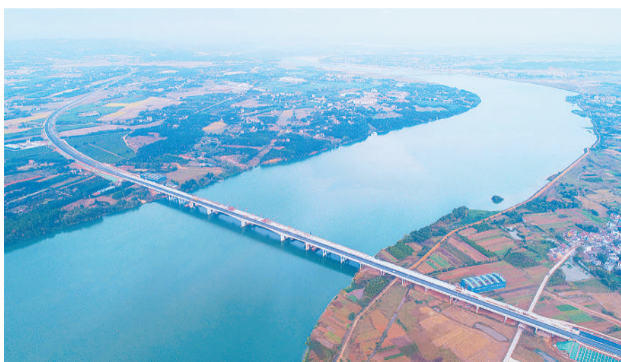
11月8日,江西省广吉高速公路泰和北赣江特大桥右幅顺利合龙,标志着泰和北赣江特大桥双幅合龙,为明年1月广吉高速公路全线通车创造条件。泰和北赣江特大桥是广吉高速公路控制性工程,左幅已于今年8月贯通。