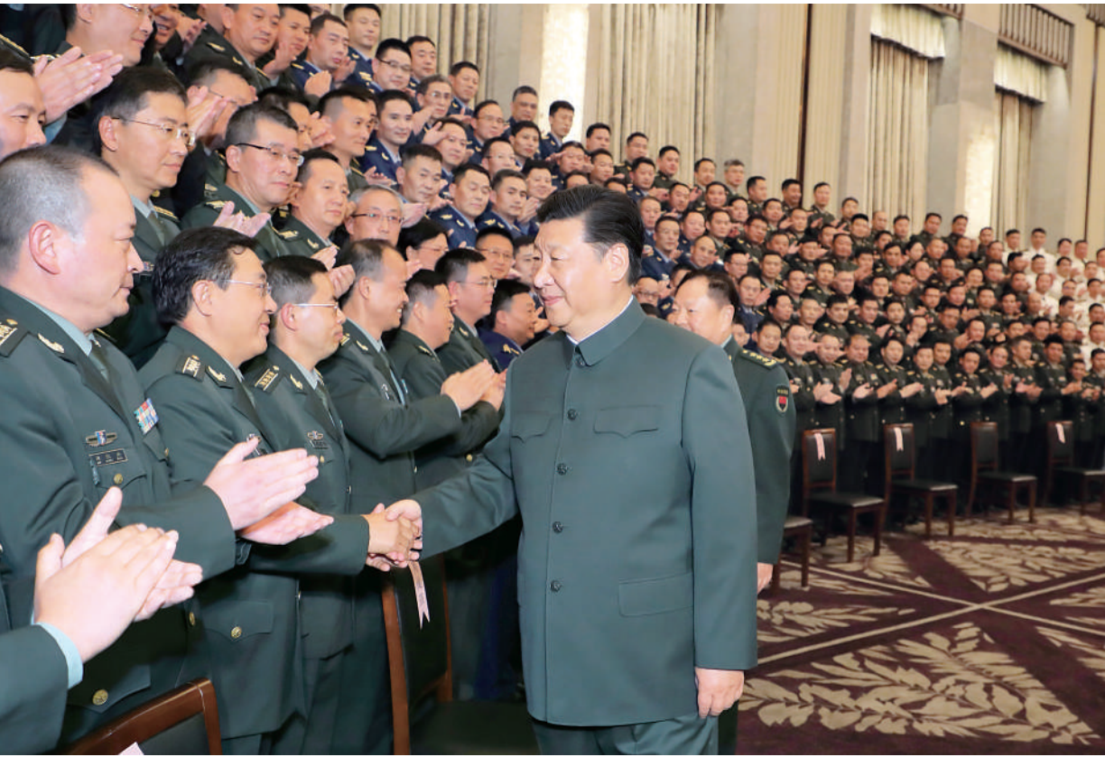
11月6日至7日,中共中央总书记、国家主席、中央军委主席习近平在上海考察。这是6日,习近平在上海亲切接见驻沪部队副师职以上领导干部和团级单位主官,代表党中央和中央军委向驻沪部队全体官兵致以诚挚问候。