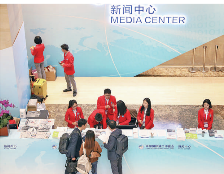
11月4日,媒体记者在首届中国国际进口博览会新闻中心咨询台咨询。当日,进博会新闻中心正式向注册记者开放。此次博览会吸引了全球630家媒体的4100多名注册记者参会报道。