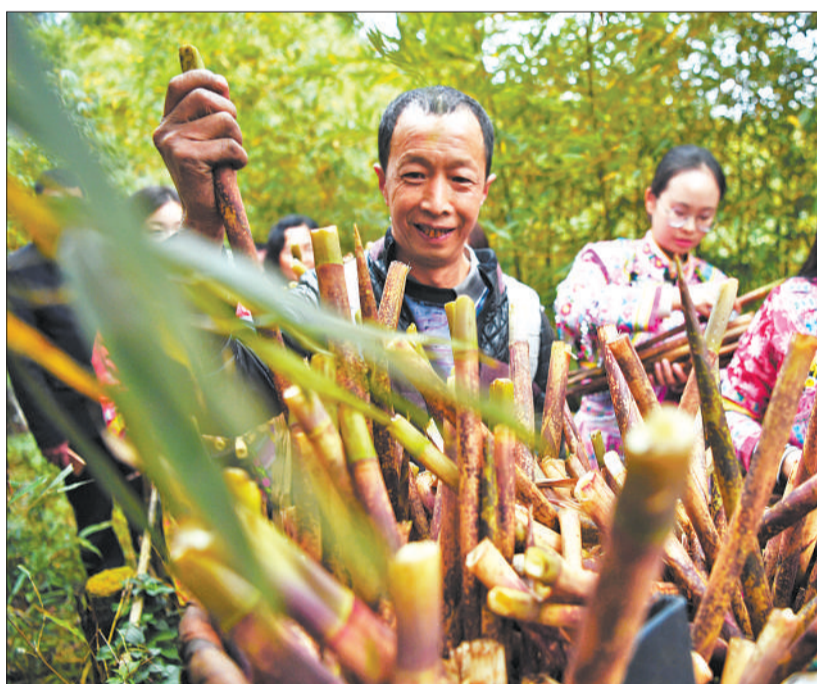
▲兴文县仙峰苗族乡村民在采挖竹笋。该县有毛竹、方竹等竹资源40.8万亩，竹产业已成为当地农民增收致富的支柱产业之一。