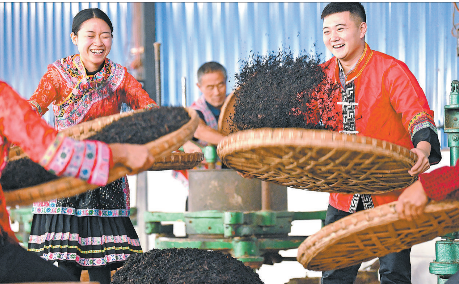
▲四川省兴文县大河苗族乡九龙山茶厂员工在加工茶叶。该县现有茶园2.68万亩，年茶叶总产量达1289吨，实现茶业综合产值2.7亿元。