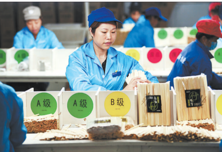
▲兴文县苗族工业园区，石海竹业的员工在包装出口日本的竹筷。今年，该公司与外商达成共同发展竹事业5年计划，预计2020年将实现出口500万美元。