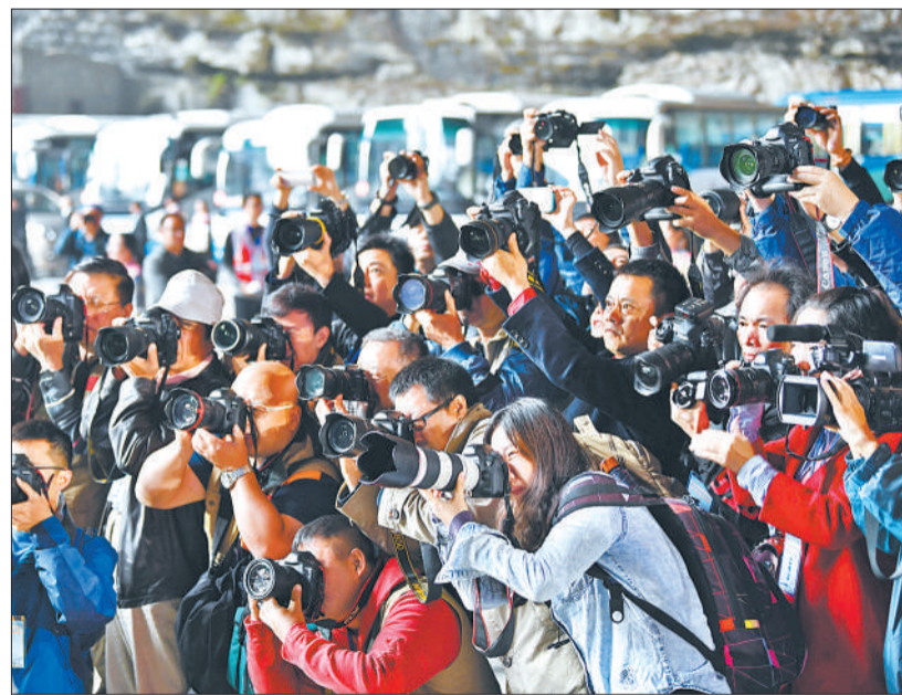
▼兴文多彩，魅力苗乡，吸引了来自全国各地的摄影爱好者。