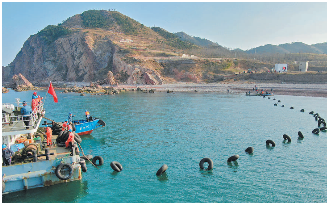
11月1日,山东省长岛县,施工人员正在敷设海底电缆。当日,施工人员完成了长岛县大钦岛至小钦岛双回路海底电缆的敷设,总长共计7.5公里。该工程将原来单回路供电变为双回路供电,使海岛居民用电更加稳定。

本届大会由中国汽车摩托车运动联合会、安徽省体育局、安徽省旅游发展委员会、芜湖市共同主办,有来自120多家汽车(房车)和露营装备制造相关企业、30多个自驾车俱乐部和200多辆汽车(房车)参展。