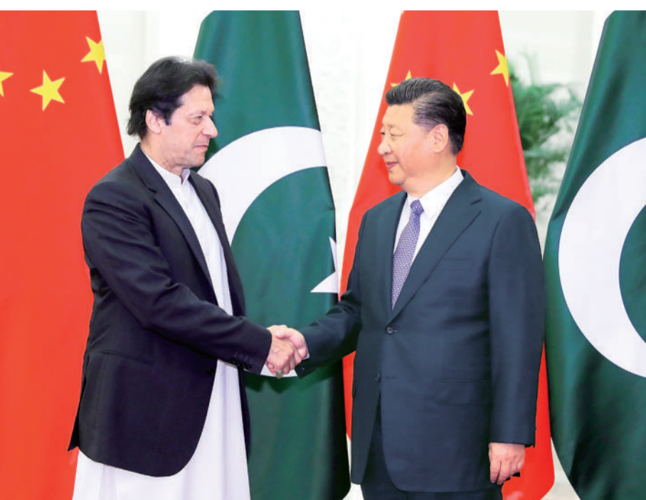
11月2日,国家主席习近平在北京人民大会堂会见巴基斯坦总理伊姆兰·汗。