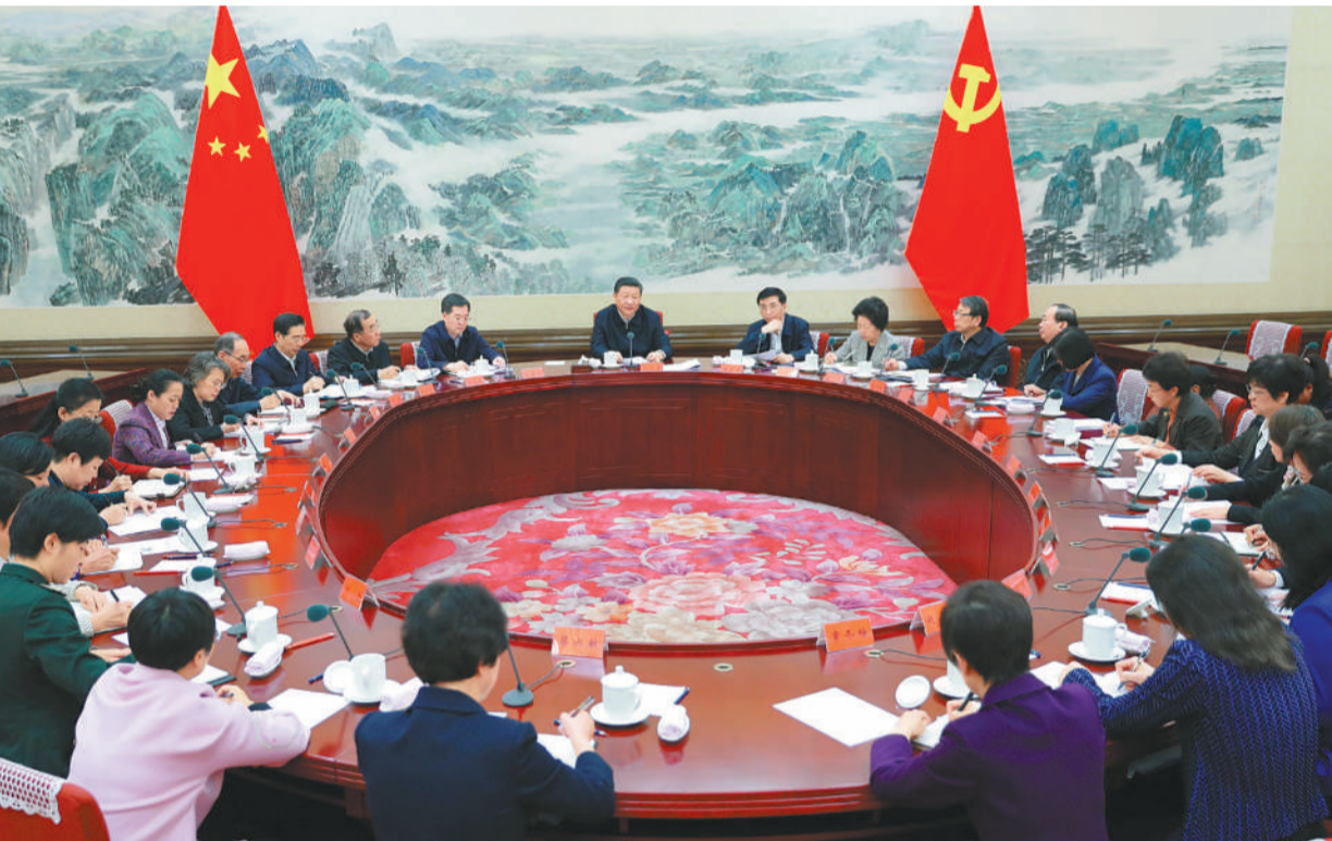
11月2日,中共中央总书记、国家主席、中央军委主席习近平在中南海同全国妇联新一届领导班子成员集体谈话并发表重要讲话。

新华社北京11月2日电 中共中央总书记、国家主席、中央军委主席习近平2日上午在中南海同全国妇联新一届领导班子成员集体谈话并发表重要讲话。习近平强调,做好党的妇女工作关系团结凝聚占我国人口半数的妇女,关系为党和人民事业发展提供强大力量。要加强对妇女工作的领导,坚持中国特色社会主义妇女发展道路,把握实现中华民族伟大复兴的中国梦这一当代中国妇女运动的时代主题,促进男女平等,发挥妇女在各个方面的积极作用,组织动员妇女走在时代前列,在改革发展稳定第一线建功立业。