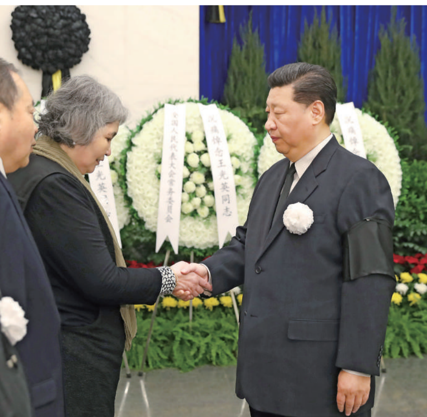
11月2日,王光英同志遗体在北京八宝山革命公墓火化。习近平、李克强、栗战书、汪洋、王沪宁、赵乐际、韩正、王岐山、胡锦涛等前往八宝山送别。这是习近平与王光英亲属握手,表示深切慰问。

新华社北京11月2日电 中国现代民族工商业者的优秀代表,著名的社会活动家,中国民主建国会和中华全国工商业联合会的杰出领导人,中国共产党的亲密朋友,第八届、九届全国人民代表大会常务委员,全国人大常委会第六、七届全国委员会副主席,中国民主建国会第三届中央委员会常务副主任委员,中华全国工商业联合会第五届、六届执行委员会副主席,第七届、八届执行委员会名誉主席,原中国光大(集团)总公司名誉董事长王光英同志的遗体,2日在北京八宝山革命公墓火化。