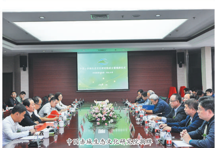
中国赤城生态文化研究院揭牌