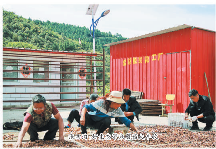
张西沟生态带农产加工