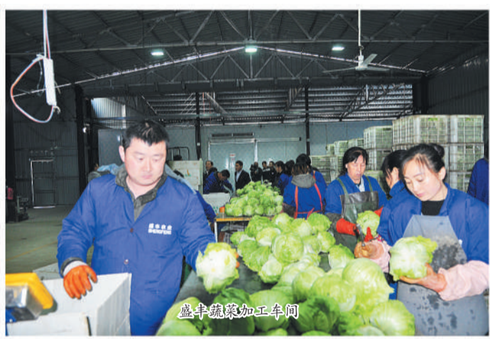
错季蔬菜加工车间