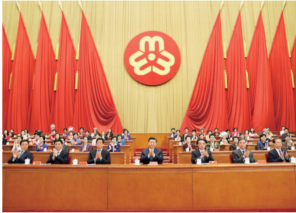
10月30日,中国妇女第十二次全国代表大会在北京人民大会堂开幕。习近平、李克强、栗战书、汪洋、王沪宁、赵乐际、韩正等在主席台就座,祝贺大会召开。

中共中央书记处书记,全国人大常委会、国务院、全国政协、中央军委有关领导同志出席会议。中央和国家机关有关部门、军队有关单位、各民主党派中央、全国工商联负责人,各人民团体、北京市负责同志,部分在京部级女领导干部和全国妇联老领导,首都各界妇女代表参加开幕式。