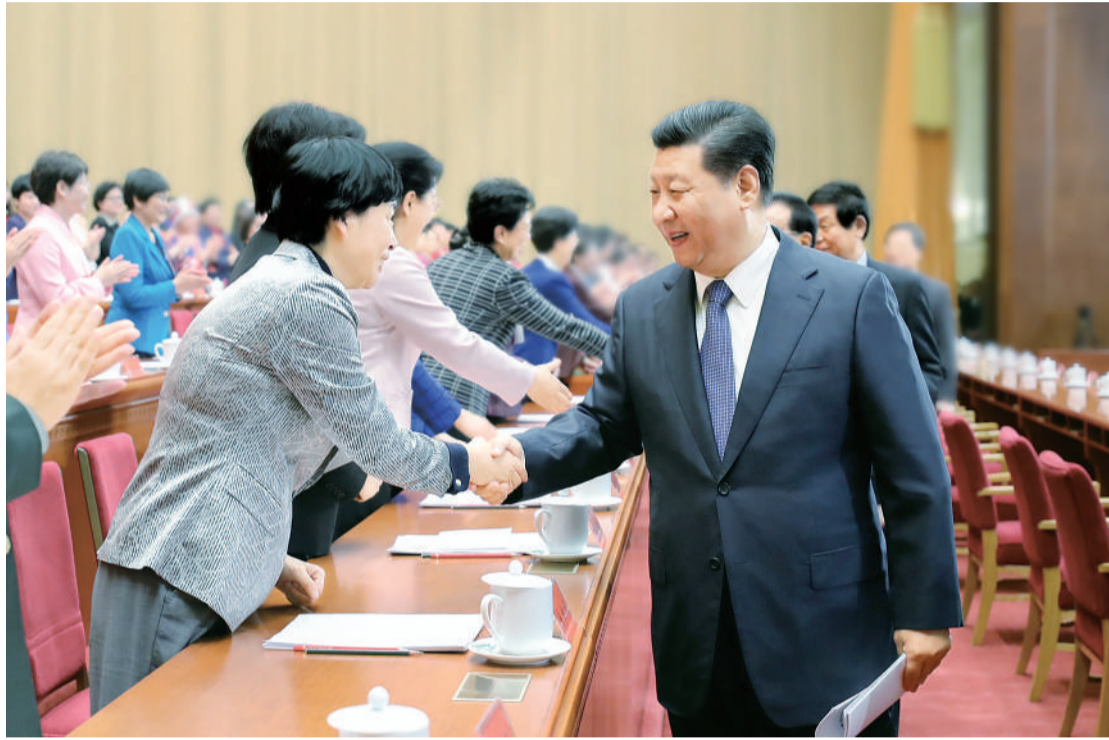
10月30日,中国妇女第十二次全国代表大会在北京人民大会堂开幕。这是中共中央总书记、国家主席、中央军委主席习近平等与会代表亲切握手。

新华社北京10月30日电 (记者杨维汉 黄小希) 中国妇女第十二次全国代表大会30日上午在人民大会堂开幕。习近平、李克强、栗战书、汪洋、王沪宁、韩正等党和国家领导人到会祝贺,赵乐际代表党中央致词。