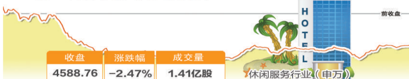
10月26日波动最大行业走势图

我国资本市场自然人投资者账户占比超99% 中国证券投资者保护基金公司26日发布的2017年度《中国资本市场投资者保护状况白皮书》显示,我国资本市场投资者账户数量共计1.34亿户,其中自然人投资者账户占比99.73%