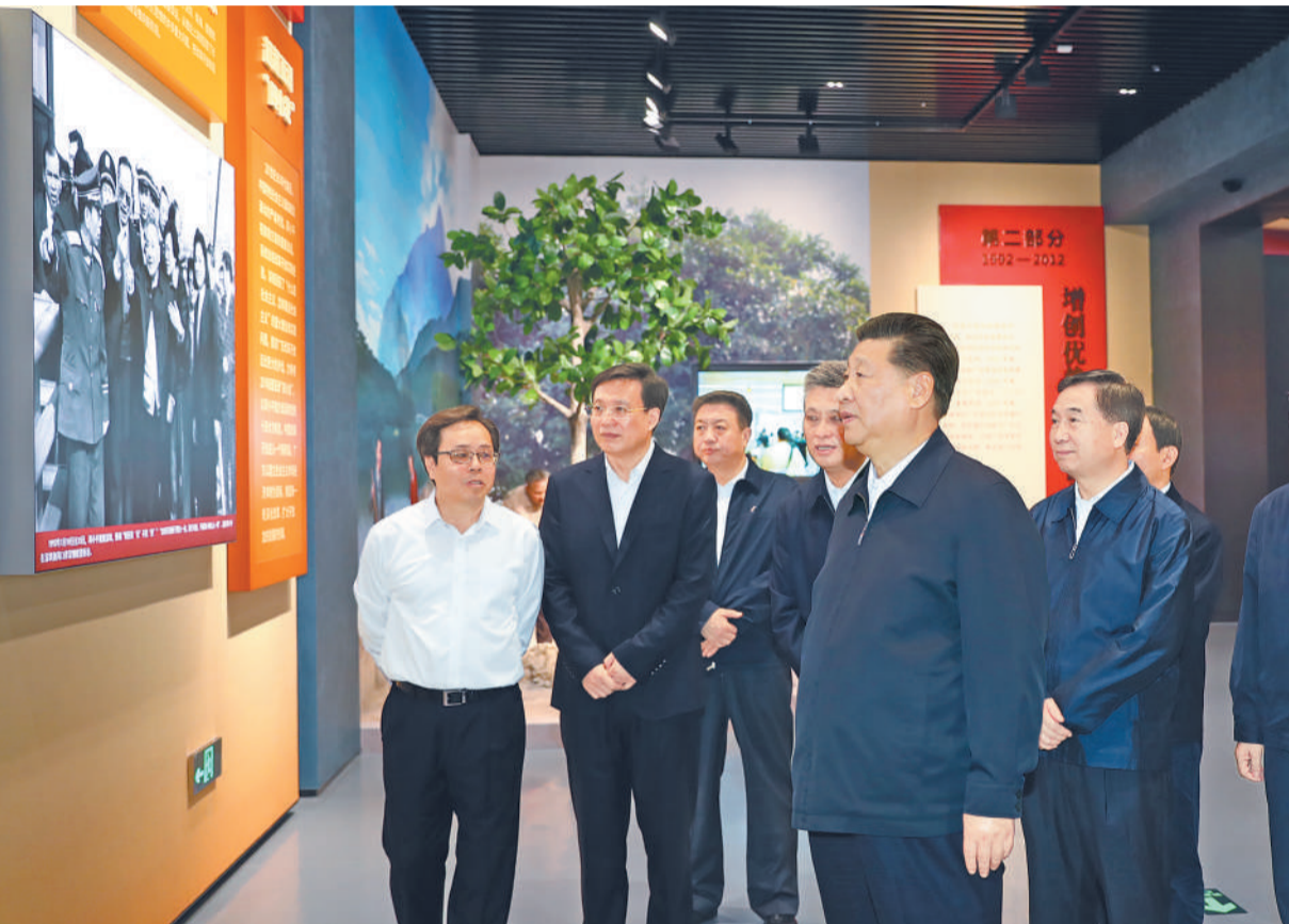
10月22日至25日,中共中央总书记、国家主席、中央军委主席习近平在广东考察。这是10月24日上午,习近平在深圳参观“大潮起珠江——广东改革开放40周年展览”。