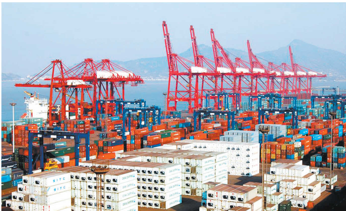
图为连云港港冷箱集装箱码头。