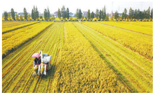
10月17日，江苏省太仓市双凤镇的早稻开镰收割，该市大面积水稻收割工作预计月底全面铺开。