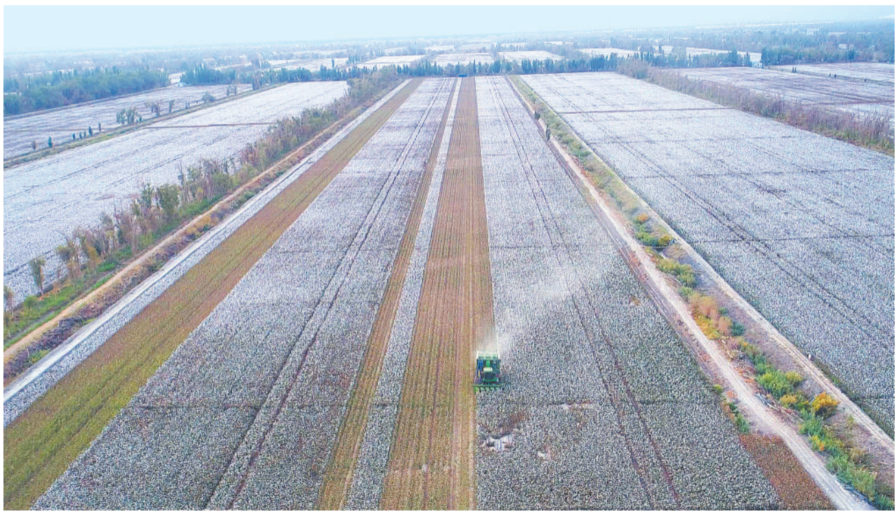
10月19日，新疆铁门关市二十九团棉花里采摘机正在采收新棉。时下，新疆天山南北棉花采摘进入高峰期。新疆生产建设兵团投入1700余台采摘机帮助农民采收新棉，解决了手工采摘费用高、雇工难等问题。

中国社会科学院副院长高培勇在论坛上表示，全面贯彻党的十九大报告关于加强中国特色新型智库建设的精神，既需要实践经验，也需要理论研究，是一项难度较大且复杂的工程。面对这一问题，需要开展大量的探索和研究。