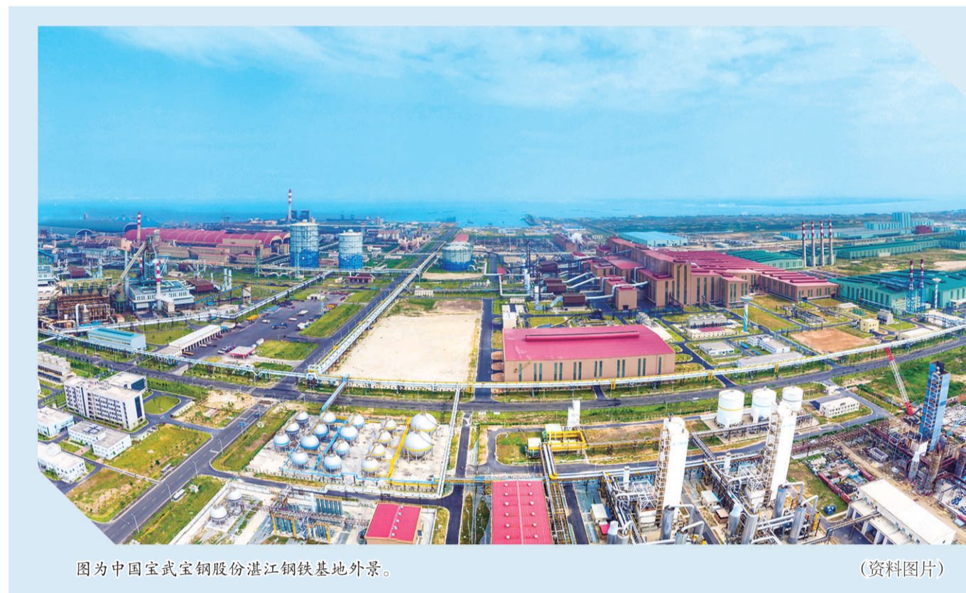
图为中国宝武宝钢股份湛江钢铁基地外景。