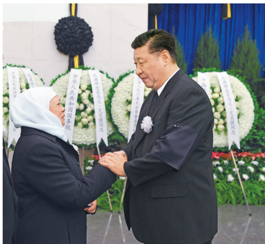
10月18日,司马义·艾买提同志遗体送别在北京八宝山革命公墓举行。习近平、栗战书、汪洋、王沪宁、赵乐际、韩正、王岐山、胡锦涛等前往八宝山送别。这是习近平与司马义·艾买提亲属握手,表示深切慰问。

习近平、栗战书、汪洋、王沪宁、赵乐际、韩正、王岐山、胡锦涛等到八宝山革命公墓送别。