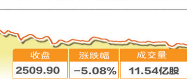
10月18日波动最大行业走势图