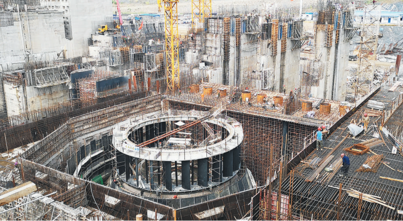
10月11日，广西桂平大藤峡水利枢纽工程正在紧张施工。大藤峡水利枢纽是珠江流域防洪控制性枢纽工程，也是珠江—西江经济带和“西江亿吨黄金水道”基础设施建设的标志性工程。

本报武汉10月12日电 记者柳洁、通讯员张静报道：10月12日，由中铁大桥局承建的汉(武汉)十(十堰)高铁崔家营汉江特大桥主梁成功合龙。