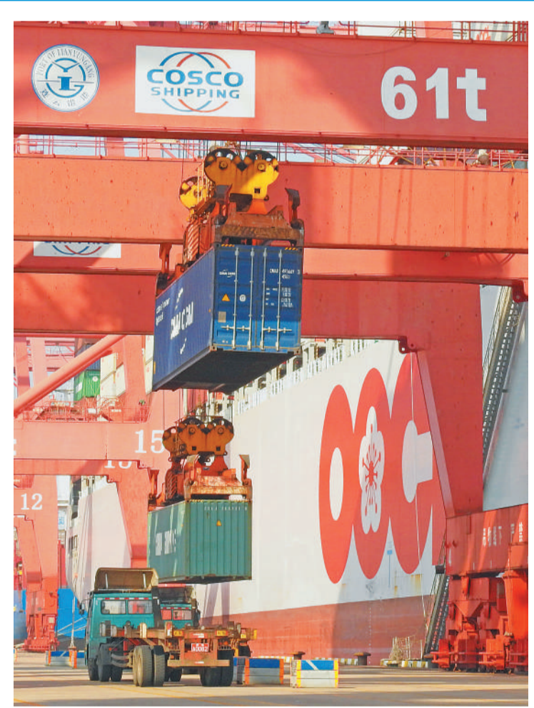
10月12日,轮船在江苏连云港港口集装箱码头装卸集装箱。海关总署当日发布的数据显示,2018年前三季度,我国货物贸易进出口总值22.28万亿元人民币,比去年同期增长9.9%。 (详细报道见第四版)

革的探索思考和生动实践。 改革开放以来,杭州从缺矿产、缺港口的资源小市一跃成为经济强市。进入工业化后期,传统产业占比过高、科技综合实力不强等矛盾日益凸显。同时,新一轮科技和产业革命兴起,数字经济带来了世界经济的大调整、大转型。杭州抓住机遇,抢先布局,制造业叠加数字经济的“新制造”故事正在悄然上演。 走进中策橡胶集团有限公司的生产车间,一条条流水线井然有序。“以前需要人力进行橡胶块的分拣,每一个因子都会影响橡胶块质量。”车间负责人介绍,ET工业大脑应用到车间后,通过人工智能算法,处理分析每一块橡胶的信息,匹配最优的合成方案,有效地稳定了混炼胶性能。中策橡胶集团副总经理张利民表示,通过挖掘生产数据的潜力,公司良品率提高了5到8个百分点,而一个项目的良品率提升1%,便意味着上千万元的利润。 (下转第三版)