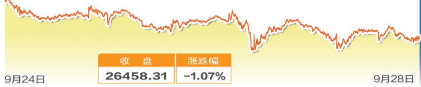
道琼斯工业指数一周走势图