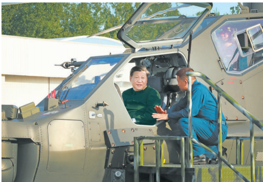
9月27日至28日,中共中央总书记、国家主席、中央军委主席习近平视察79集团军,接见驻辽宁部队副师职以上领导干部。这是27日下午,习近平登上直-10武装直升机,亲自操控机载武器及观瞄系统,了解有关装备情况。