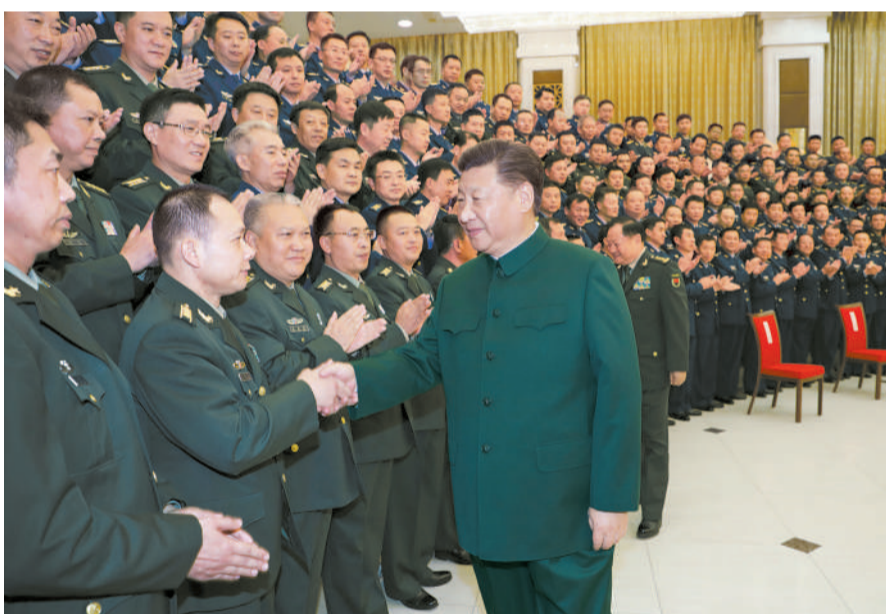
9月27日至28日,中共中央总书记、国家主席、中央军委主席习近平视察79集团军,接见驻辽宁部队副师职以上领导干部。这是28日上午,习近平在沈阳亲切接见驻辽宁部队副师职以上领导干部。

特色社会主义思想和新时代党的强军思想武装官兵,加强光荣传统教育和战斗精神培育,加强基层风气建设,打牢部队听党指挥的思想政治根基,强化官兵敢打必胜的坚定信念。各级要满腔热忱关心关爱官兵,主动为官兵解决实际困难,把官兵练兵