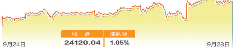
日经225指数一周走势图