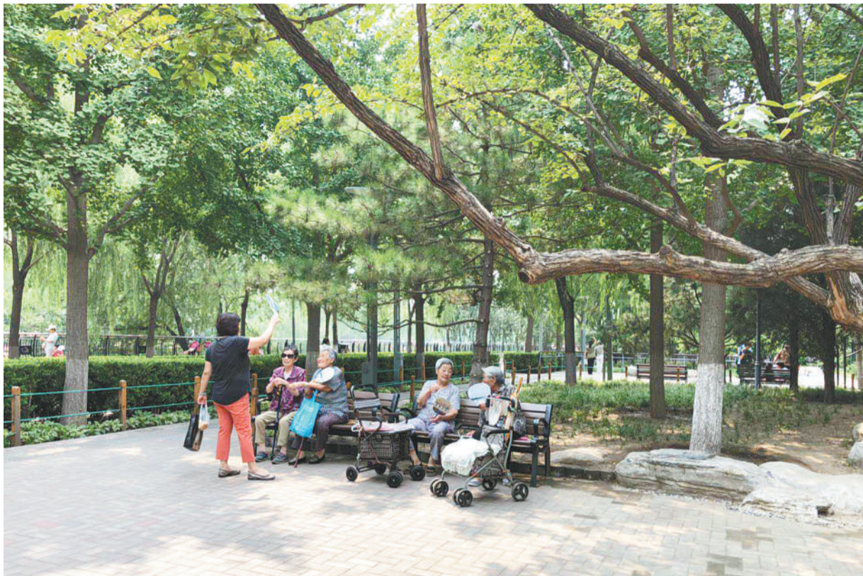
老人们在莲花河公园里休憩、聊天。

通过推进“疏解整治促提升”专项行动,北京市加快对背街小巷的整治、对闲置土地和腾退土地的绿化美化等,让城市绿意铺展。按照相关规划,2025年,北京市将达到国家森林城市标准,为建设国际一流的和谐宜居之都提供坚实的生态保障