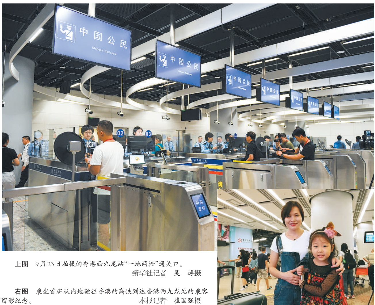
上图 9月23日拍摄的香港西九龙站“一地两检”通关口。