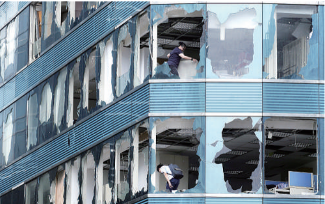
下图 9月17日,在香港九龙半岛红磡海滨的一座写字楼中,工作人员在清理窗户破损的办公室。