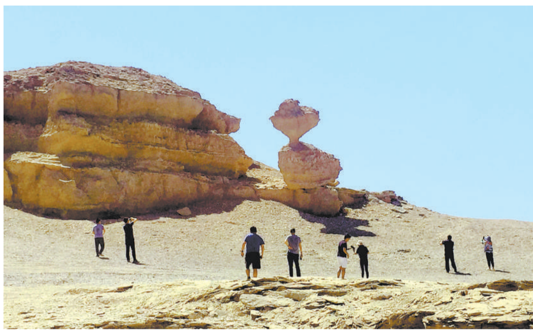
右图 游客在哈密大海道探秘。

新疆哈密大海道，丝绸之路古通道。经千百年风沙“雕刻”，大海道成为极具代表性的雅丹地貌区域。这里辽阔苍凉，山体造型各异，置身其中，犹如走进奇幻秘境，仿佛星际空间。