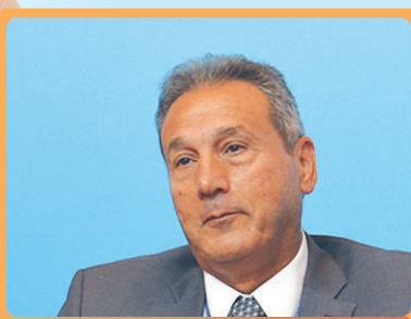
穆罕默德·埃特雷比