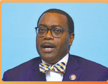
阿金武米·阿德希纳

非洲开发银行行长阿金武米·阿德希纳表示，中非之间的伙伴关系不仅仅在于中国帮助非洲修更多路、建设更多港口，更在于帮助非洲人民增强自我发展的能力。 阿金武米·阿德希纳说，非洲拥有廉价的制造业成本、年轻的人口结构、快速的经济增长、旺盛的新兴市场需求等，这都是吸引投资的重要优势。由于缺乏制造业的支撑，非洲农业人口仍然占绝大多数，无法成功实现经济转型。基础设施建设是非洲实现工业化的前提和基础，非洲有很多地方现在还没有通电，加强基础设施建设仍然是重要任务。非洲自然资源丰富，出口大多集中于原材料，因此需要建立完整的供应链，生产高附加值产品。 阿金武米·阿德希纳认为，在非洲有4个国家实现了非常好的发展，分别是塞内加尔、卢旺达、吉布提和埃塞俄比亚，他们都是通过充分利用中国投资，加快了基础设施互联互通，并以此为依托发展制造业，从而促进了经济增长。 阿金武米·阿德希纳表示，非洲开发银行是非洲最大的地区性政府间开发金融机构，主要向非洲地区成员国贷款，支持农业、交通和通讯、工业、基础设施、卫生教育和私营领域的发展。希望更多中国民营企业到非洲开展多元化的投资，非洲开发银行将为他们提供相应的项目开发服务和风险防范支持。 文/本报记者 周明阳