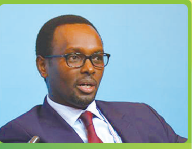
伊曼纽尔·哈蒂杰卡