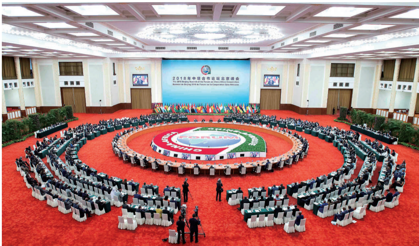
9月4日,中非合作论坛北京峰会圆桌会议在北京人民大会堂举行。国家主席习近平主持第一阶段会议。