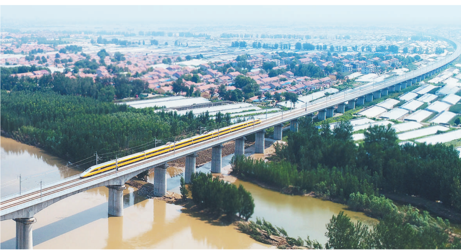
8月24日,一列联调联试动车呼啸通过中铁上海局建设的济青高铁潍坊坊子特大桥。济青高铁联调联试快速稳步推进,当日,列车最高速度达到每小时385公里,即将完成第一阶段的提速试验工作。