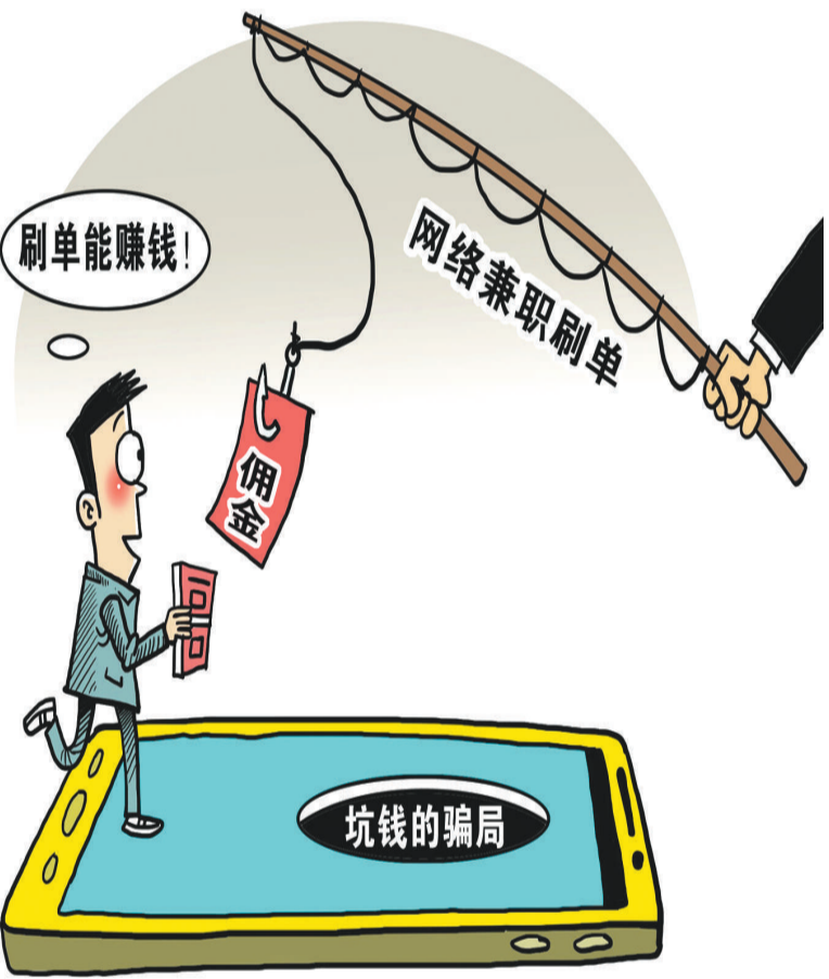
朱慧卿作

对于共享单车企业来说，一方面要建立高效的回收利用生产线，及时消化报废的共享单车，另一方面也要对共享单车实行供给侧结构性改革，严格限制生产数量，科学测算市场需求量。