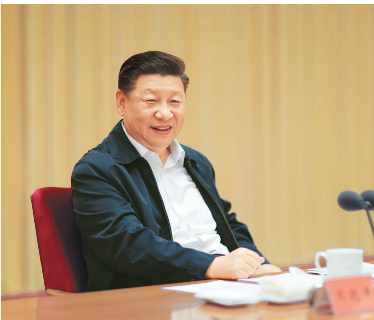
8月21日至22日,全国宣传思想工作会议在北京召开。中共中央总书记、国家主席、中央军委主席习近平出席会议并发表重要讲话。

习近平强调,做好新形势下宣传思想工作,必须自觉承担起举旗帜、聚民心、育新人、兴文化、展形象的使命任务。举旗帜,就是要高举马克思主义、中国特色社会主义的旗帜,坚持不懈用新时代中国特色社会主义思想武装全党、教育人民、推动工作,在学懂弄通做实上下功夫,推动当代中国马克思主义、21世纪马克思主义深入人心、落地生根。聚民心,就是要牢牢把握正确舆论导向,唱响主旋律,壮大正能量,做大做强主流思想舆论,把全党全国人民士气鼓舞起来、精神振奋起来,朝着党中央确定的宏伟目标团结一心向前进。育新人,就是要坚持立德树人、