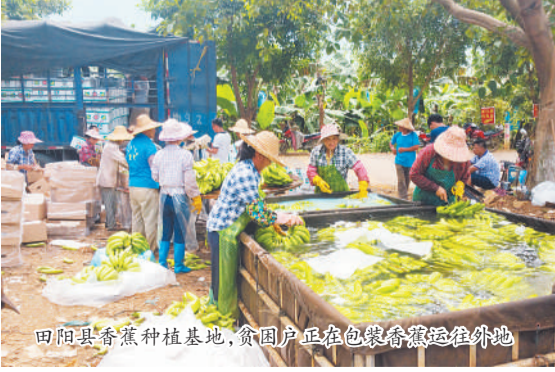
田阳县香蕉种植基地,贫困户正在包装香蕉运往外地