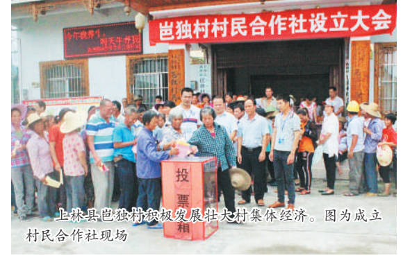
上林县巴都村脱贫攻坚驻村工作队集体经济。图为成立村民合作社现场

全区贫困户住院费用实际报销比例达90%。三是住房保障。加大贫困户农村危房改造力度,优先安排项目指标,人均补助标准提高到2.65万元,2017年完成10.51万贫困户危房改造任务。