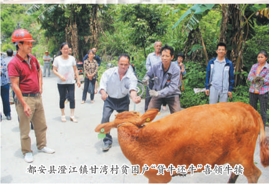
都安县澄江镇甘湾村贫困户“黄牛还牛”喜领牛犊

(五) 全面落实“三保障”政策。一是义务教育保障。2017年全区资助贫困户学生144.86万人次,发放补助资金18.83亿元。54个贫困县全面实施营养改善计划。加强贫困户适龄儿童控辍保学工作,努力做到贫困户适龄儿童零辍学。二是基本医疗保障。全面落实贫困人口基本医保、大病保险、医疗救助、商业保险等政策措施,建档立卡贫困人口城乡基本医保参保率100%。贫困人口基本医疗保险取消住院起付线,报销比例提高5个百分点;大病保险起付线降低50%,报销比例提高10个百分点。贫困人口全部纳入重大疾病医疗救助范围,实行医疗救助兜底。落实分类救治政策,93种致贫疾病、慢性病纳入救治范围。贫困人口全部享有签约家庭医生服务。贫困人口县域内“先诊疗、后付费”服务推广到全区。2017年