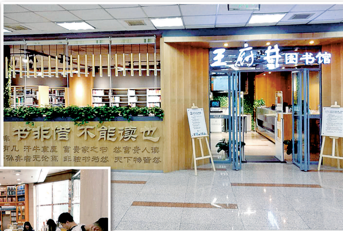
上图 北京市东城区第一图书馆王府井书店分馆今年7月2日开放营业。

通过“馆店合作”，依托书店，可以实现公共阅读设施快速布局，是一条共建共享的快速发展之路