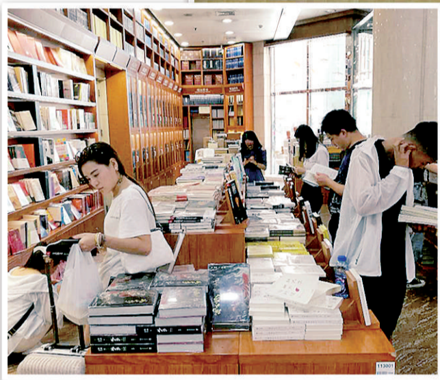
左图 王府井新华书店通过硬件升级，给读者更舒适的阅读、选购空间，实现了从单一图书综合大卖场向文化生活空间转变。

读书人的文化记忆，见证了实体书店最为辉煌的时代。不过，这些年，情况变了，电商兴起，电子书等新产品大受青睐，伴随着知识和信息传播、接受、利用方式多样化，实体书店集体陷入经营困境。