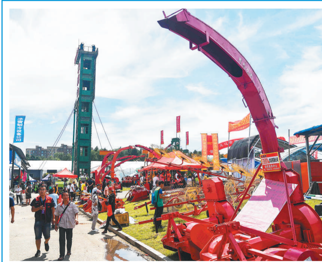
第十七届长春国际农博会开幕 8月17日，参观者在长春农博会现场参观选购农业机械。当日，为期10天的第十七届中国长春国际农业·食品博览(交易)会在长春农博园开幕。

宅基地制度改革试点启动以来，各地因地制宜推进改革，在宅基地确权登记颁证、加强村民自治管理、探索新的取得方式以及盘活闲置宅基地等方面取得了积极进展。截至今年6月底，共腾退零星、闲置宅基地9.7万户、7.2万亩。各地在确权登记的基础上，积极配合开展农民住房财产权抵押贷款试点，截至今年6月底，办理农村抵押贷款4.9万宗、98亿元。