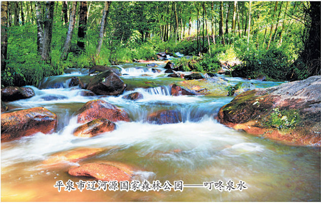
平泉市辽河源国家森林公园——叮咚泉水