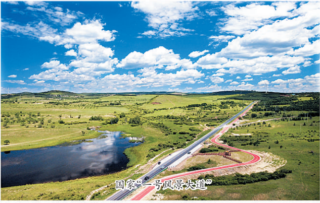
国家“一号风景大道”