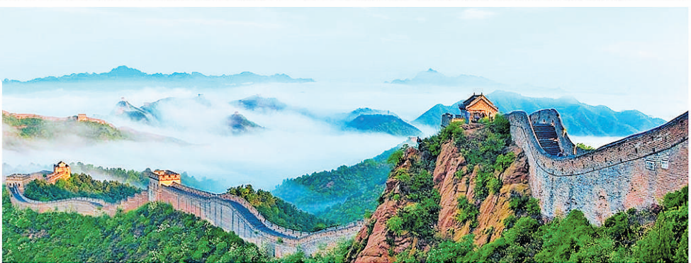
万里长城金山独秀