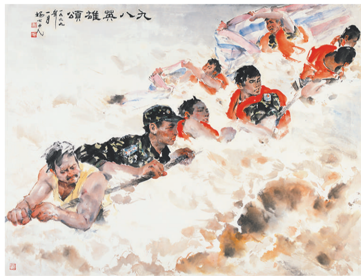
《九八英雄颂》中国画 杨之光 1999年