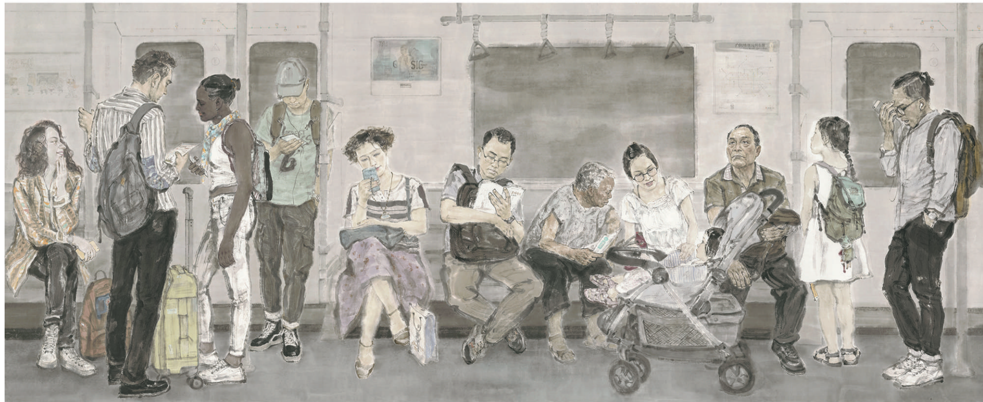
《广州地铁》(局部) 中国画 张弘 2018年