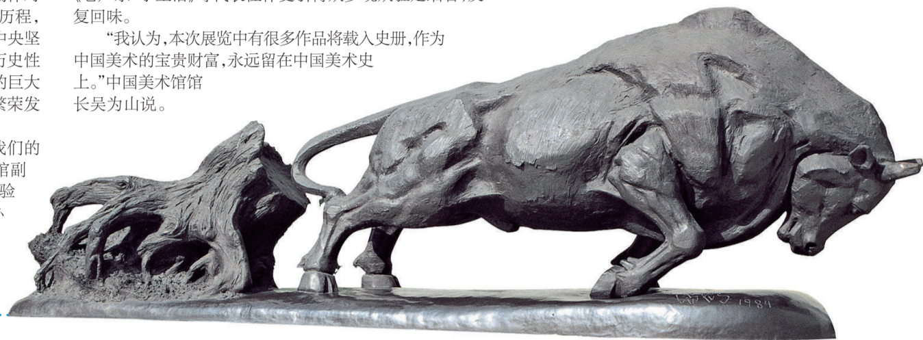
《开荒牛》雕塑 潘鹤 1978年