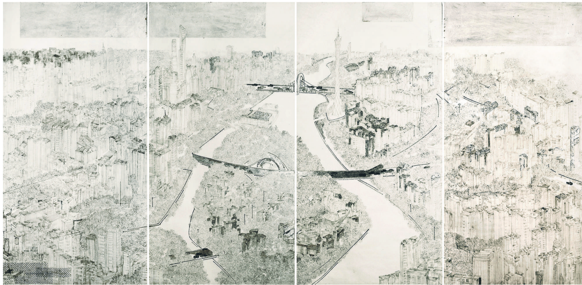
《盛世珠江》(局部) 中国画 李劲堃团队 2018年