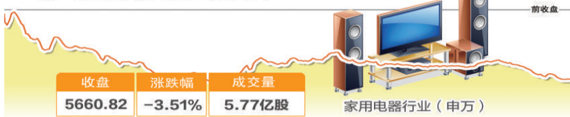
上半年家电网购市场规模达2641亿元